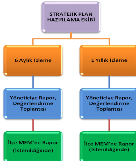
Şekil 2: İzleme ve Değerlendirme Süreci

Müdürlüğümüzün 2019-2023 Stratejik Planı İzleme ve Değerlendirme sürecini ifade eden İzleme ve Değerlendirme Modeli hazırlanmıştır. Müdürlüğümüzün Stratejik Plan İzleme-Değerlendirme çalışmaları eğitim-öğretim yılı çalışma takvimi de dikkate alınarak 6 aylık ve 1 yıllık sürelerde gerçekleştirilecektir. 6 aylık sürelerde Üst Yöneticiye rapor hazırlanacak ve değerlendirme toplantısı düzenlenecektir. İzleme-değerlendirme raporu, istenildiğinde Stratejik Geliştirme Başkanlığına gönderilecektir. Ayrıca ilimizin Mülki İdari Amirine sunulacaktır. 1 yıllık izleme-değerlendirme çalışmaları, Stratejik Planımızda yer alan hedeflerin yıllık düzeyde ifade edildiği Performans Programı ve yılsonunda gerçekleşme düzeylerinin belirlendiği Faaliyet Raporu hazırlanarak yapılacaktır. Performans Programı ve Faaliyet Raporu Üst Yöneticinin değerlendirmesinin akabinde Strateji Geliştirme Başkanlığına ve Mülki İdari Amire sunulacaktır. Yıllık izlemelerle ilgili değerlendirme toplantıları düzenlenecektir.